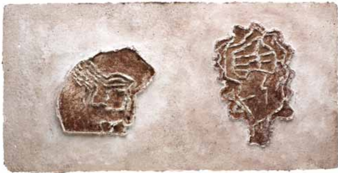
Murs, 2001 (49 x 97 x 2 cm)