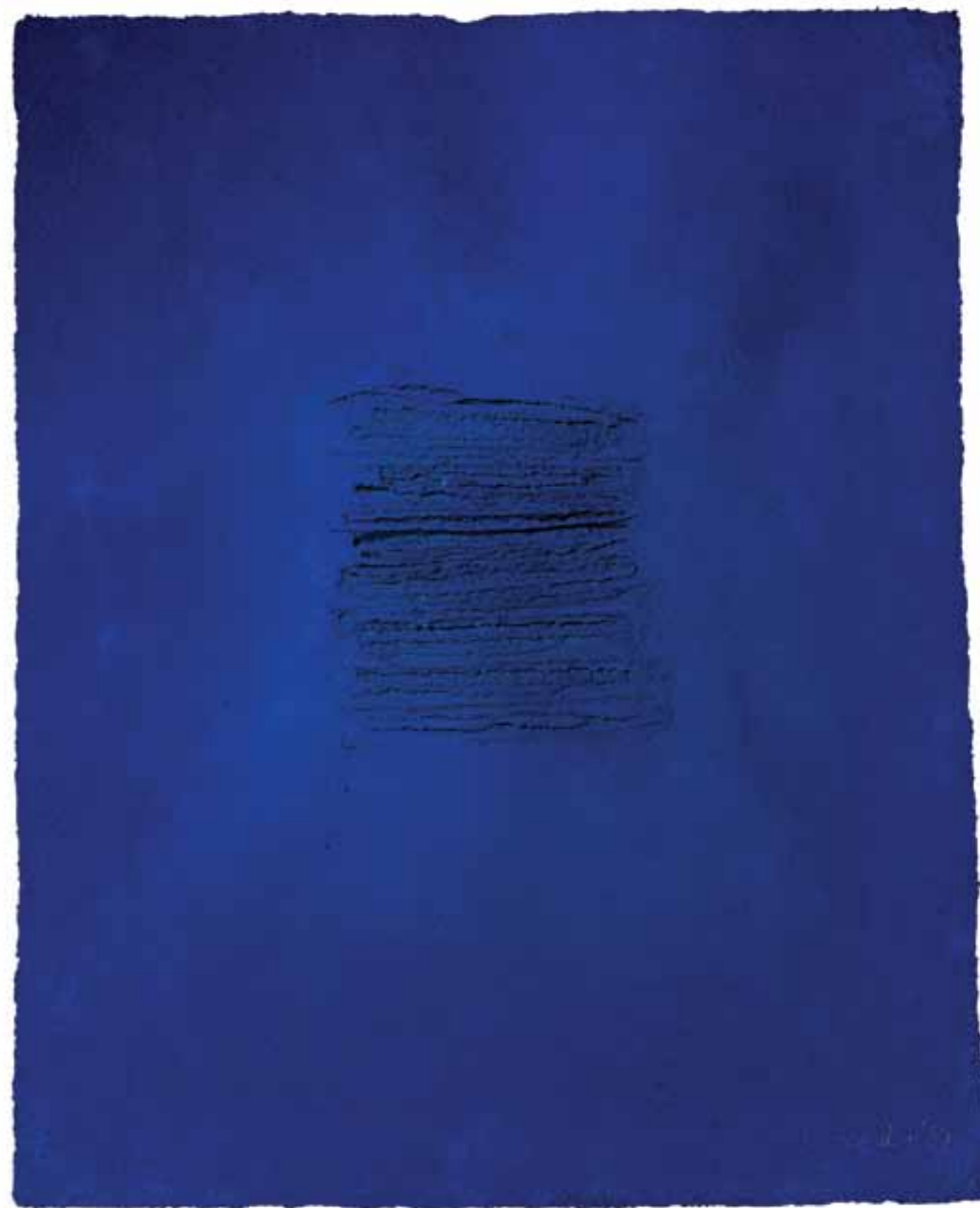
Prolog 24, 2007 (124 x 98 x 1 cm)