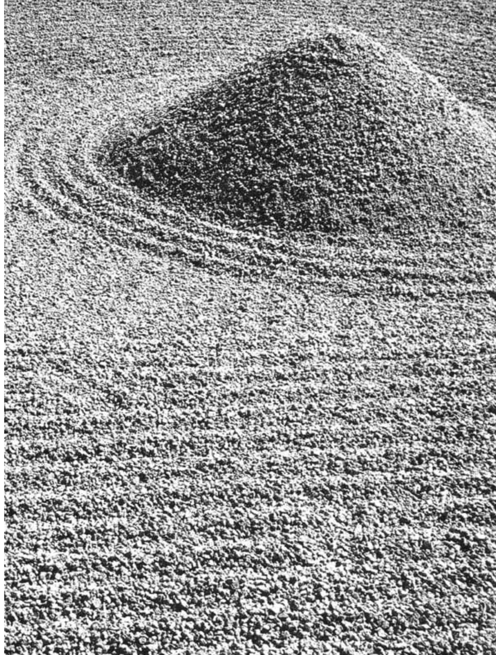
Abb. rechts: „Daisen in“. Kyôto, Der Ozean der Leerheit (Detail)