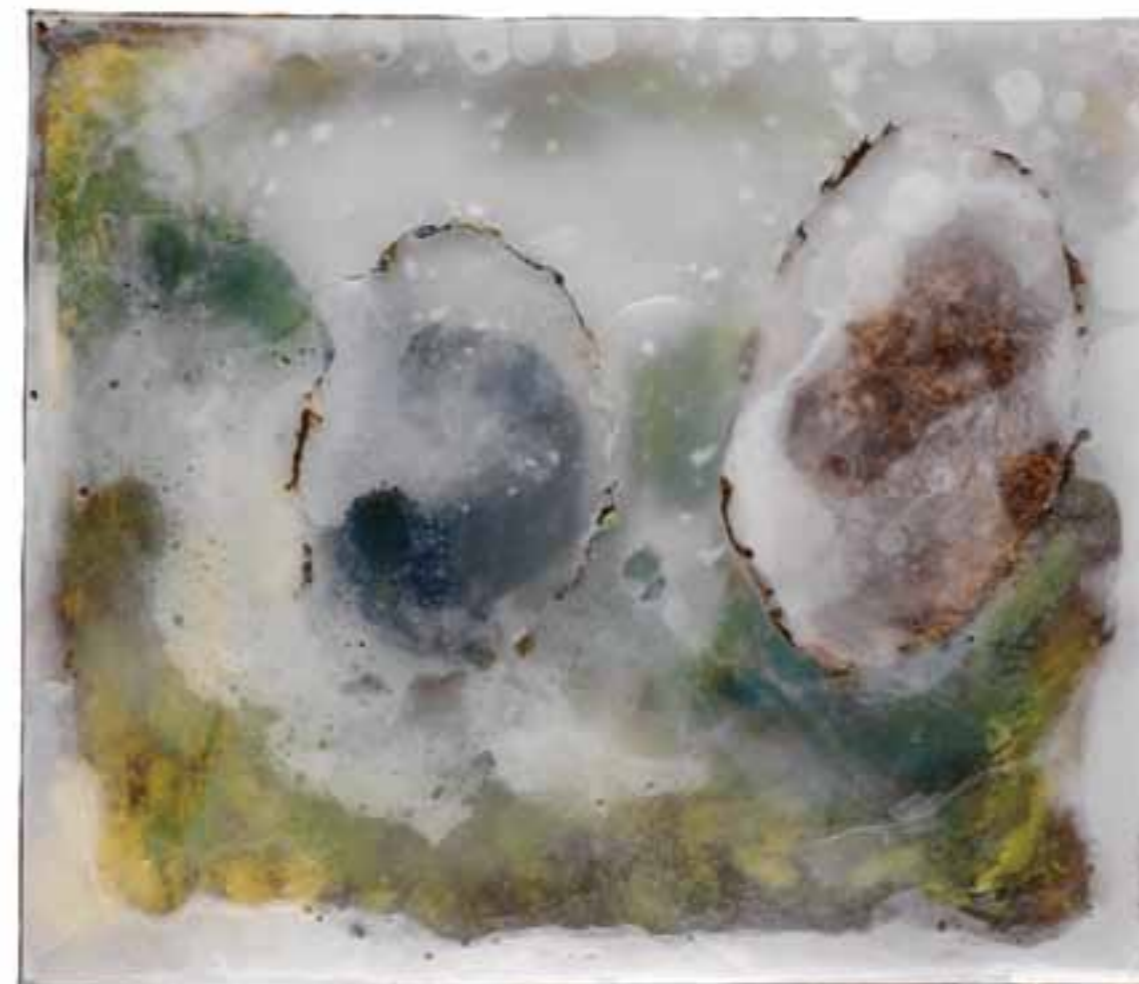
Sous glace III, 2006 (49 x 57 x 5 cm)