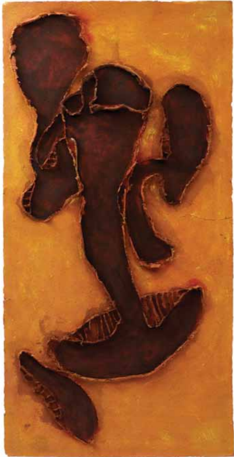
Koufonissi, 2003-06 (200 x 100 x 4 cm)