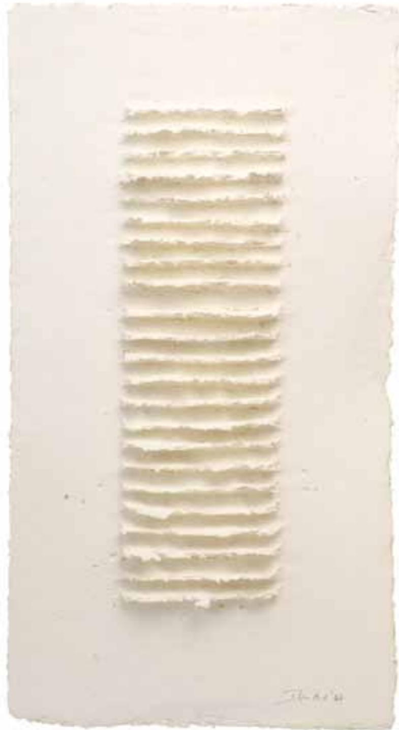
Weißes Relief 12, 2007 (65 x 35 x 2 cm)