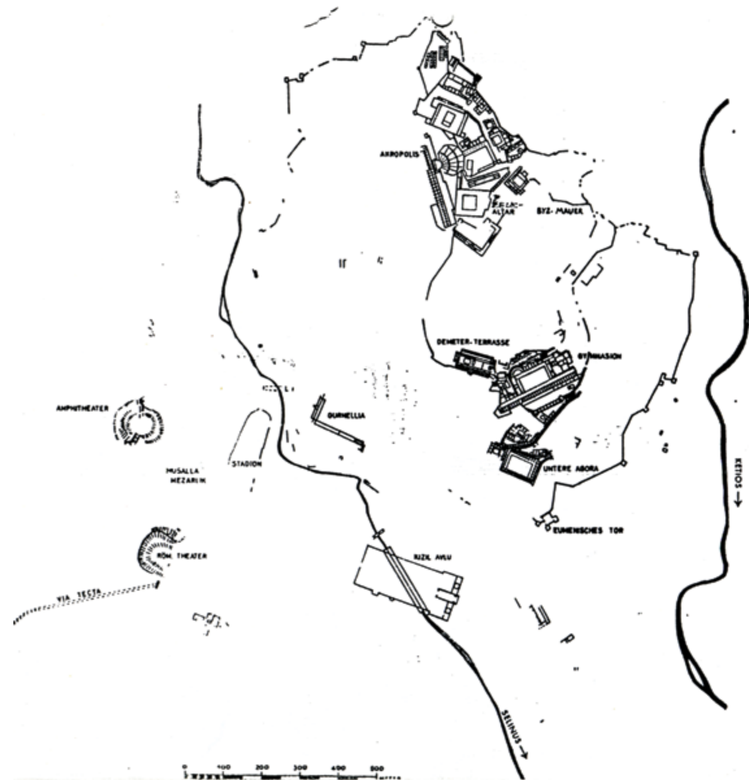
Abb. rechts: Lageplan Pergamon, Türkei