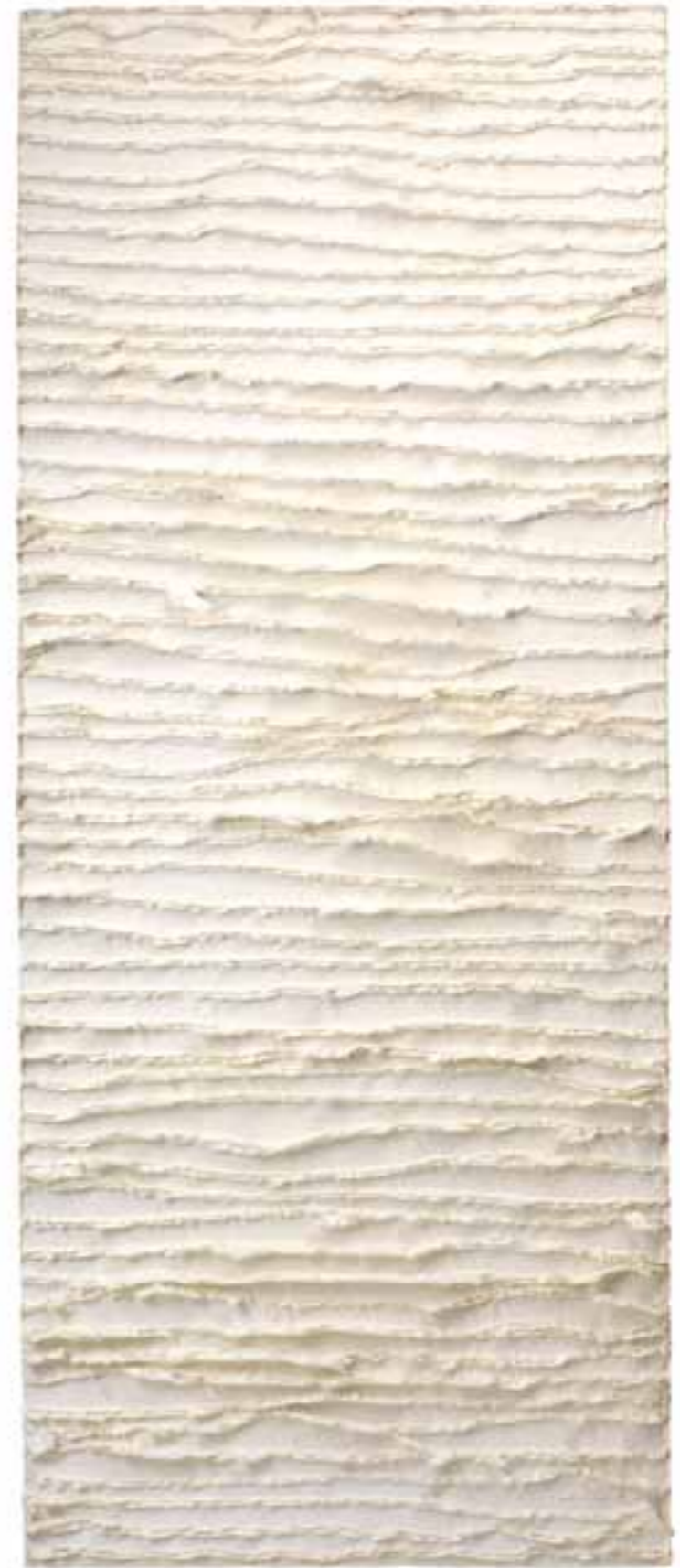
Weißes Relief 01, 2007 (98 x 48 x 3 cm)