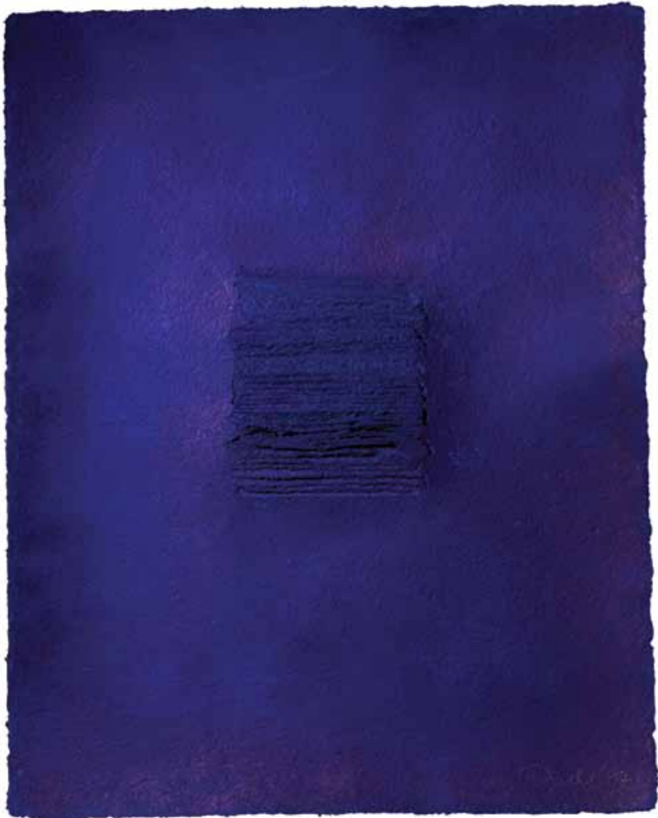
Prolog 18, 2007 (124 x 98 x 1 cm)