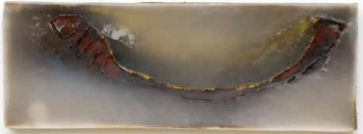
Sous glace II, 2004 (19 x 53 x 5 cm)