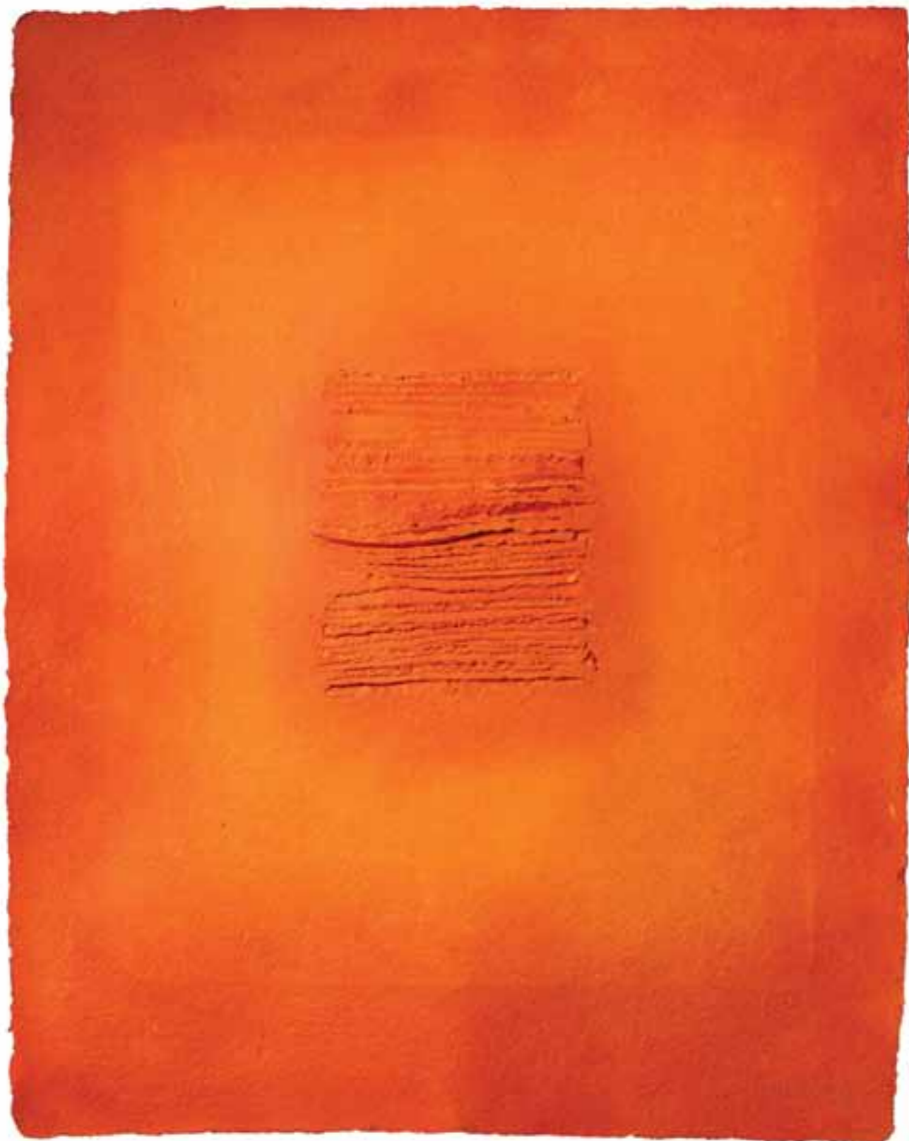
Prolog 26, 2007 (124 x 98 x 1 cm)