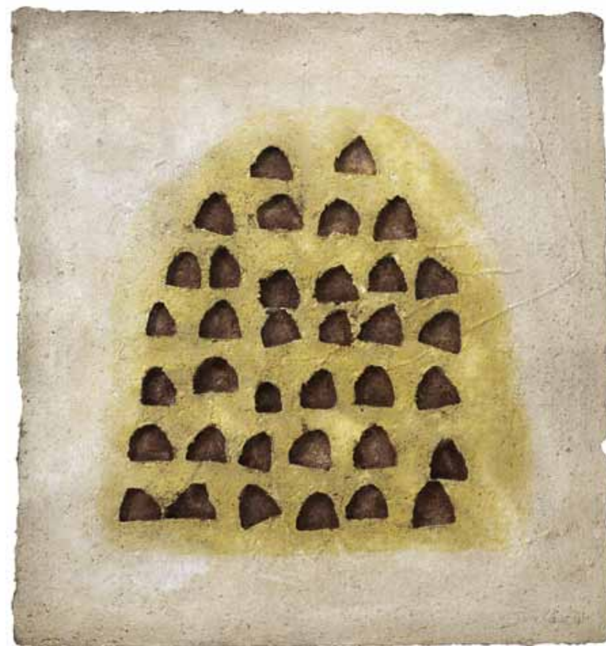
Göreme, 2006 (90 x 83 x 3 cm)