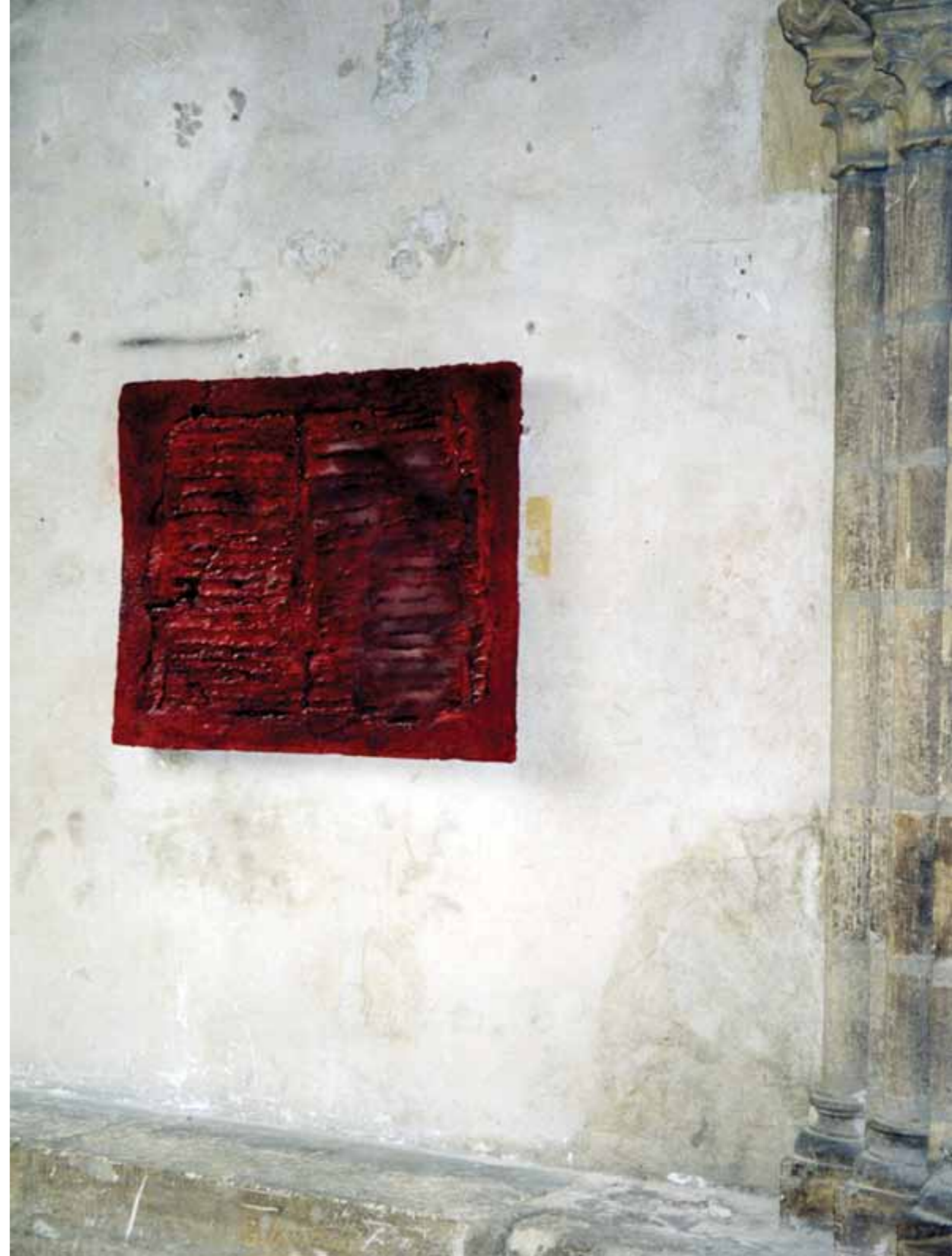
Abb. rechts: Installation im Kapitelsaal von St. Julien, Tours (F)