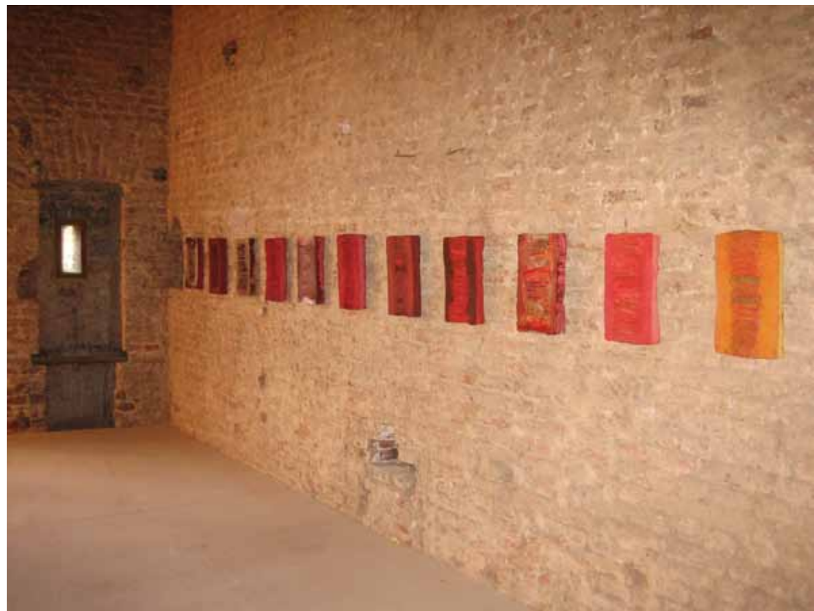
Bibliotheca conservata, Burg Bubenheim, Kleiner Saal, Düren, 2004