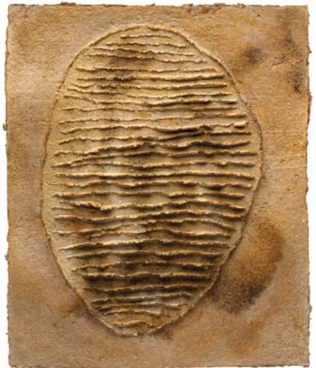
O.T. (Stadtgrundriss), 1998 (59 x 49 x 2 cm)