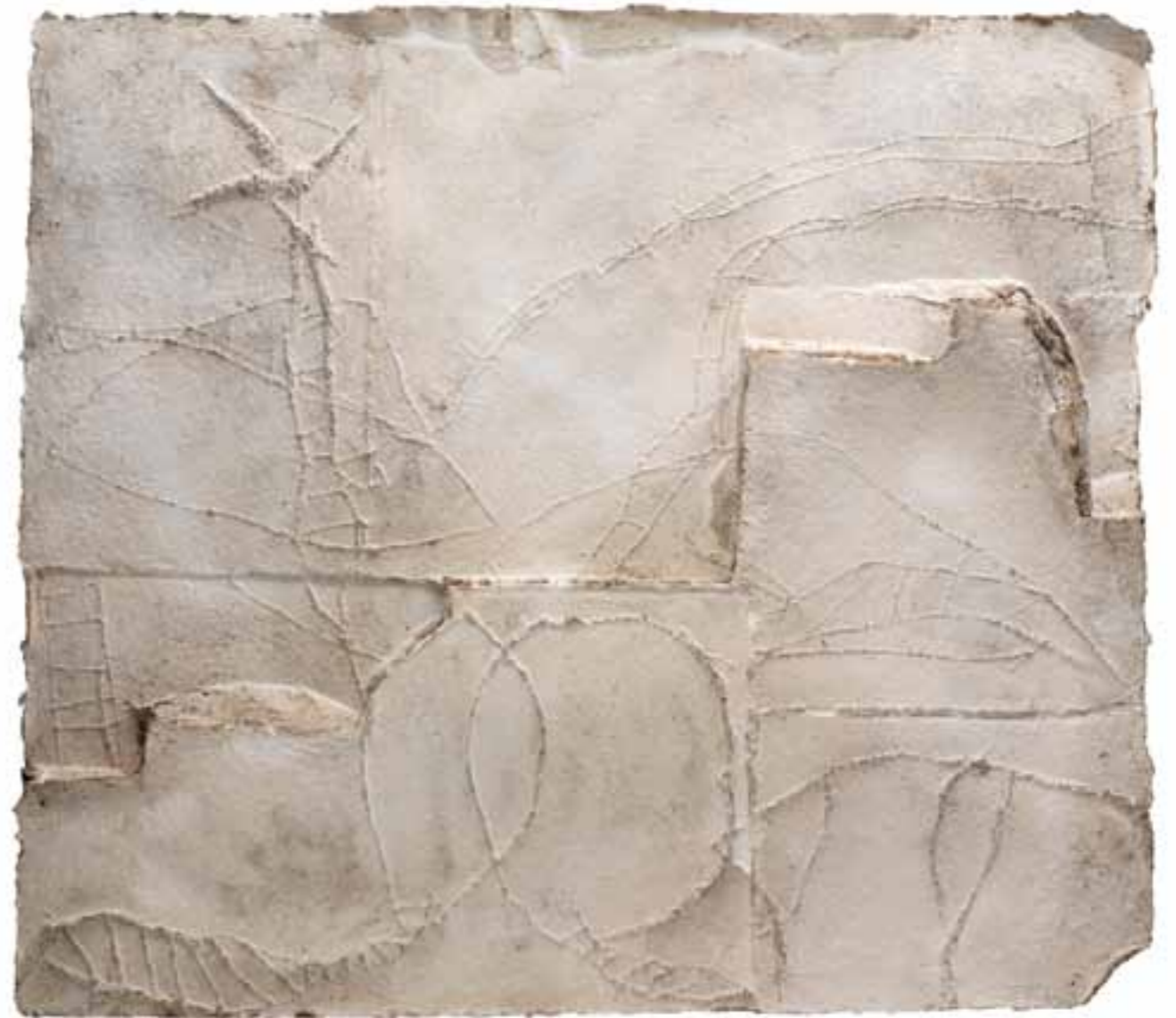
Lasithi, 2008 (86 x 98 x 8 cm)