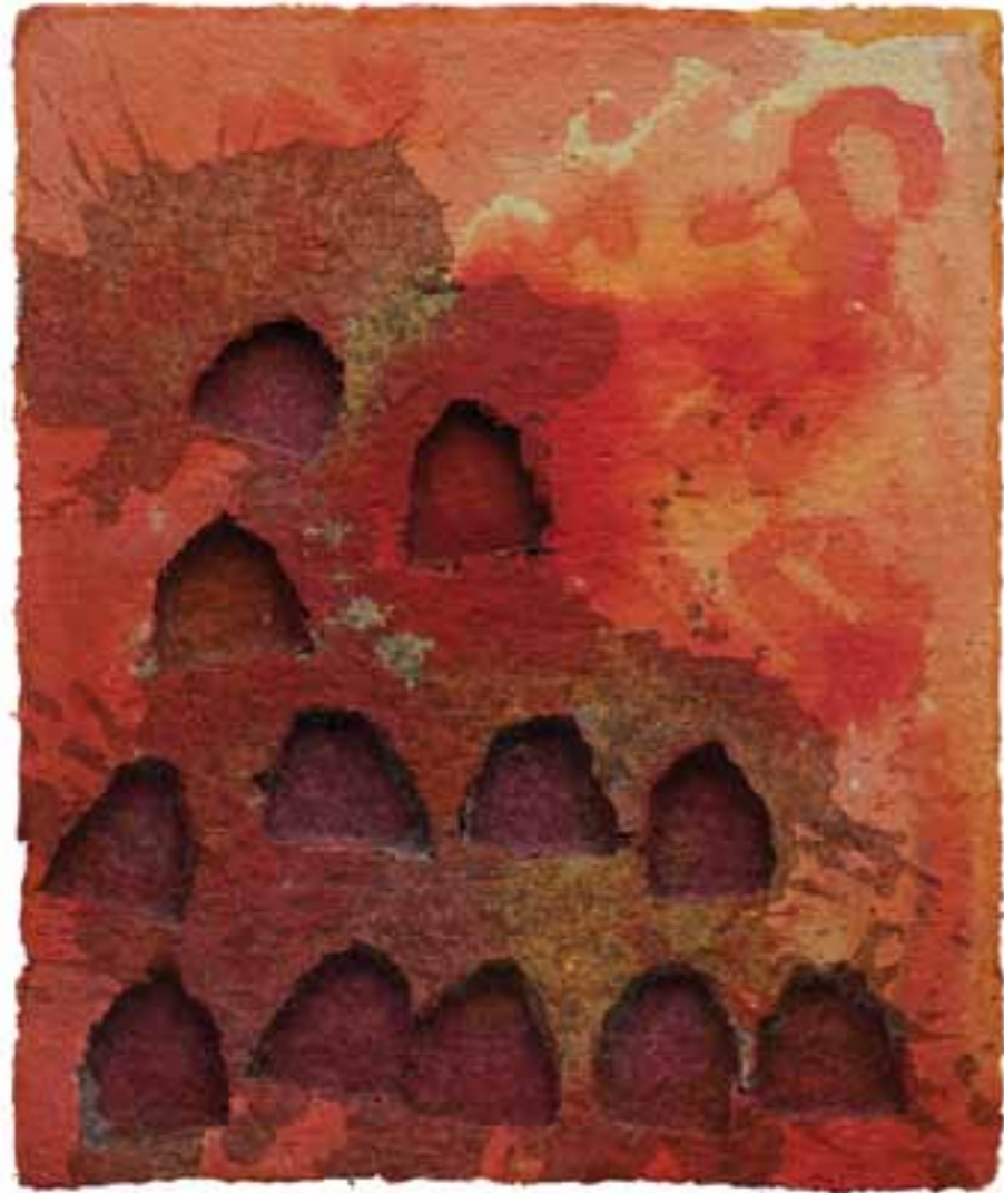
Gaillard III, 2004 (58 x 48 x 5 cm)