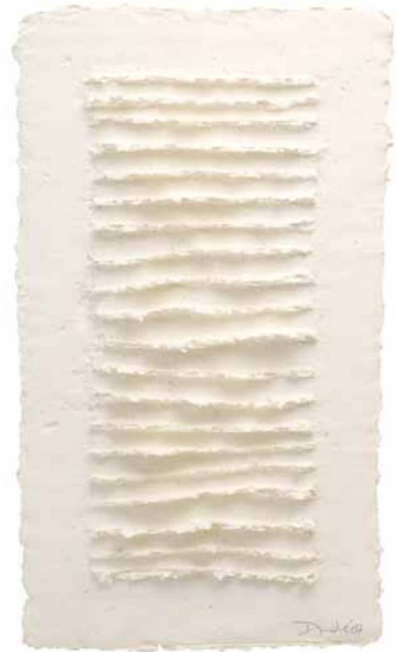
Weißes Relief 07, 2007 (44 x 26 x 2 cm)