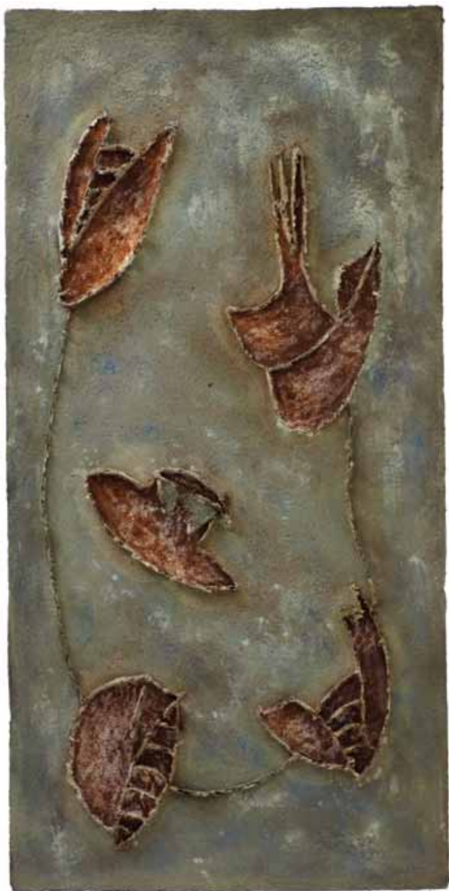
Kervoyal, 2003-06 (200 x 100 x 4 cm)