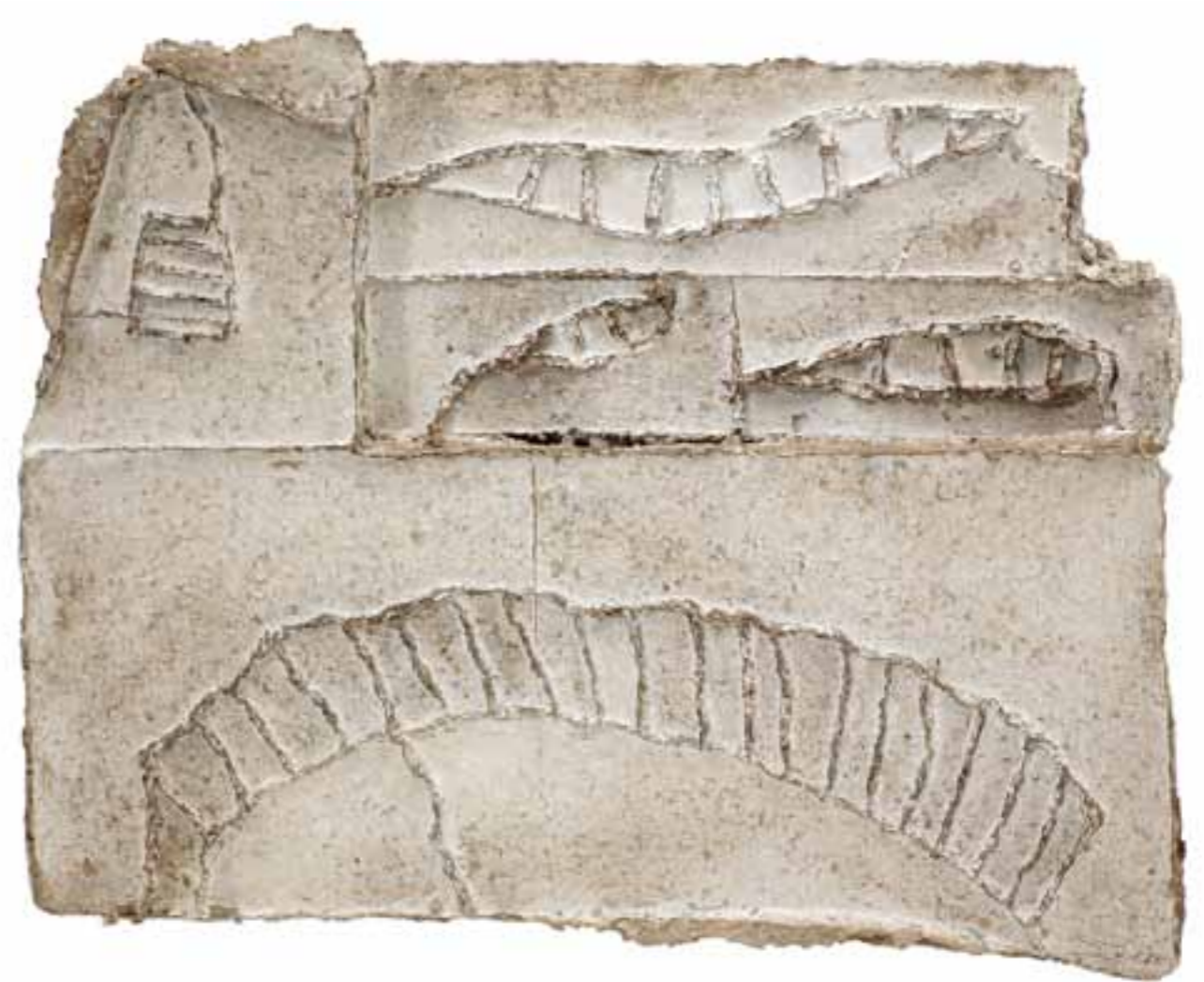
Stalker castle II, 2005 (45 x 58 x 10 cm)