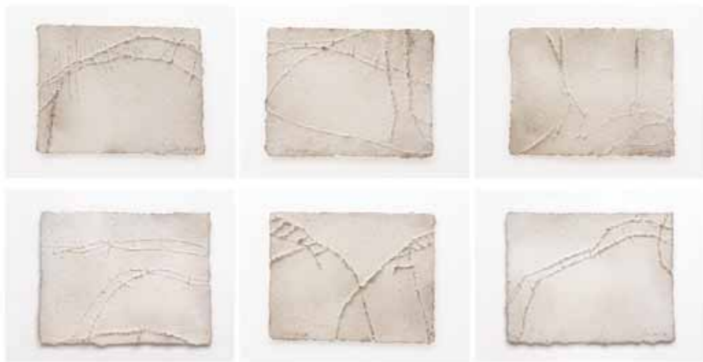
Kreta 01 - 06, 2006 (je 22 x 28 x 1 cm)