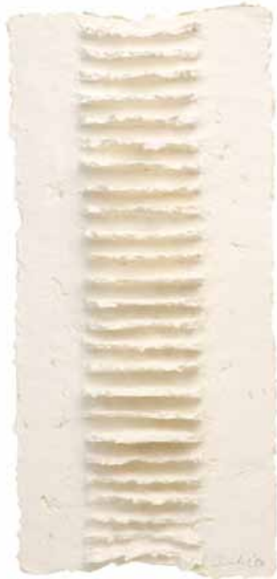
Weißes Relief 02, 2007 (40 x 18 x 2 cm)