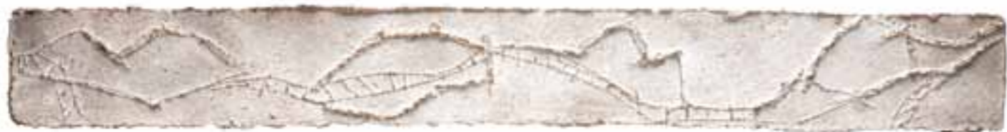
Eze, 2006 (12 x 97 x 1 cm)