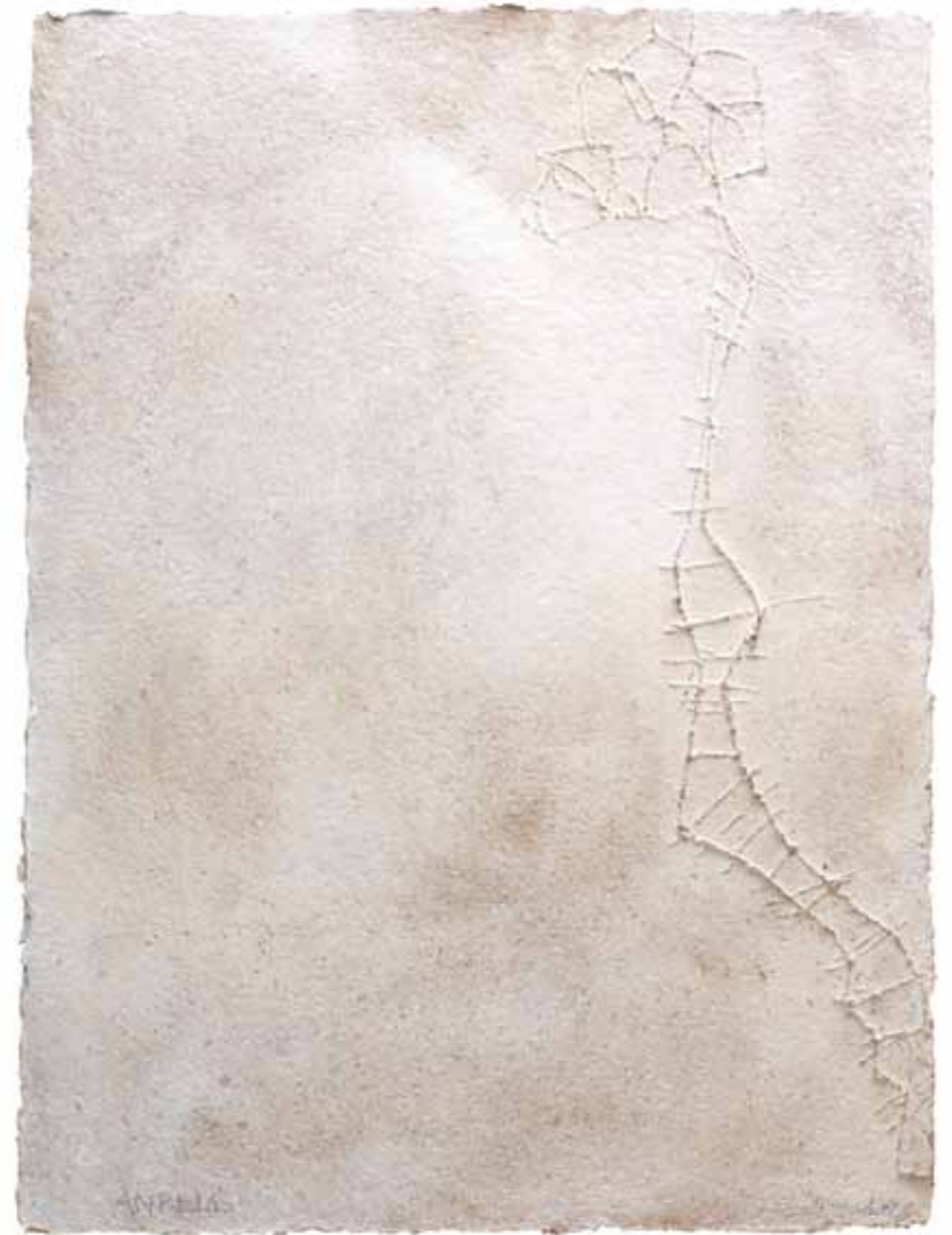
Ambelos, 2008 (71 x 53 x 1 cm)