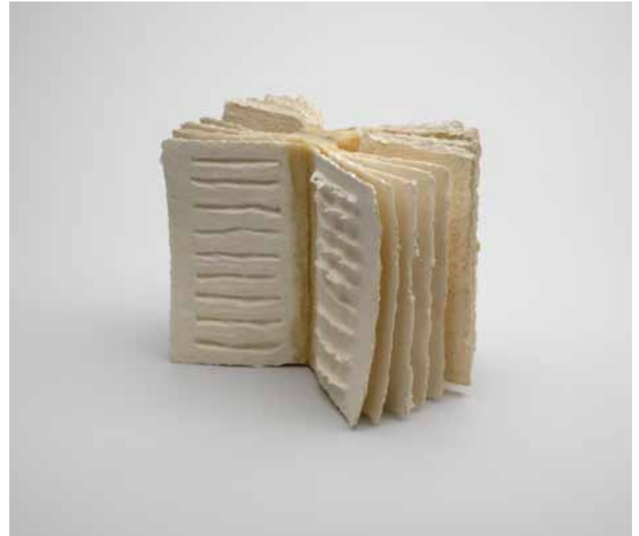
Librum, 2006 (26 x 30 x 20 cm)