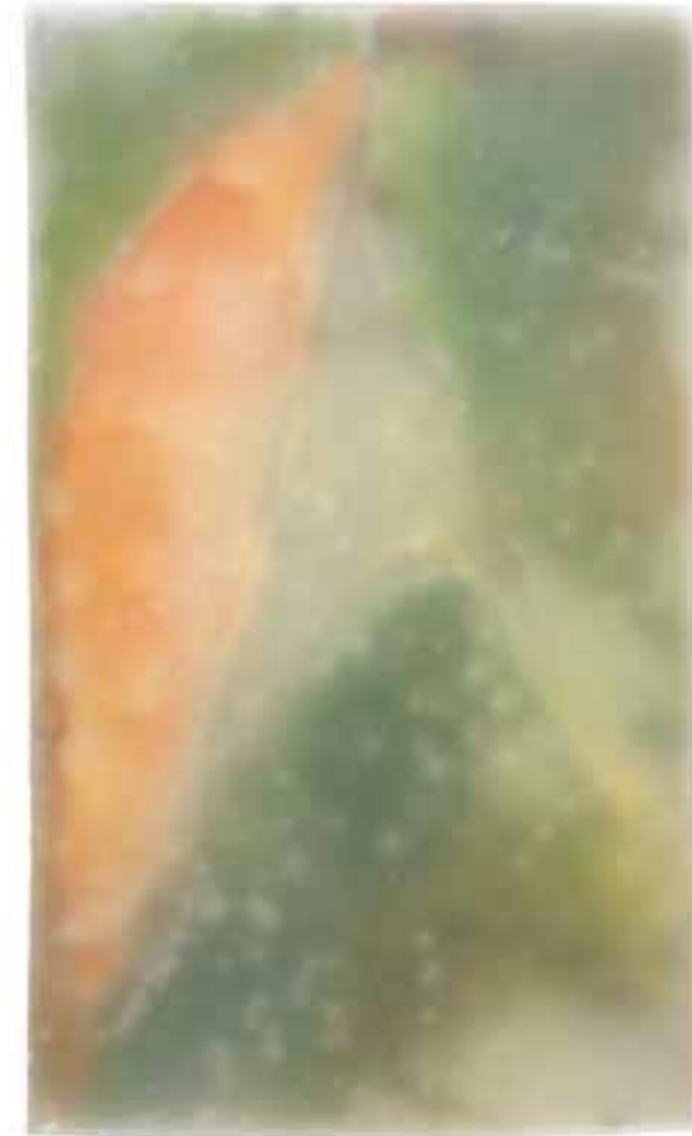
St. Marguérite, 2006 (42 x 25 x 3 cm)