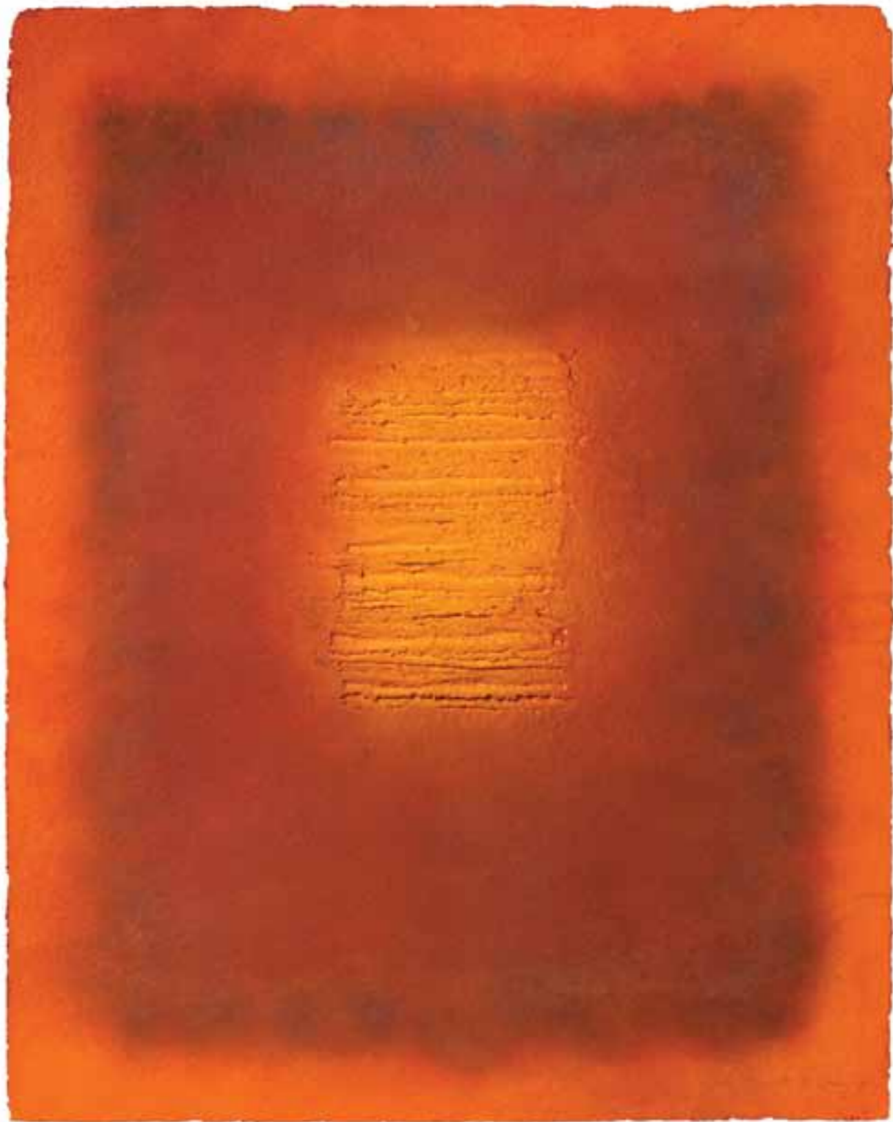
Prolog 15, 2007 (124 x 98 x 1 cm)