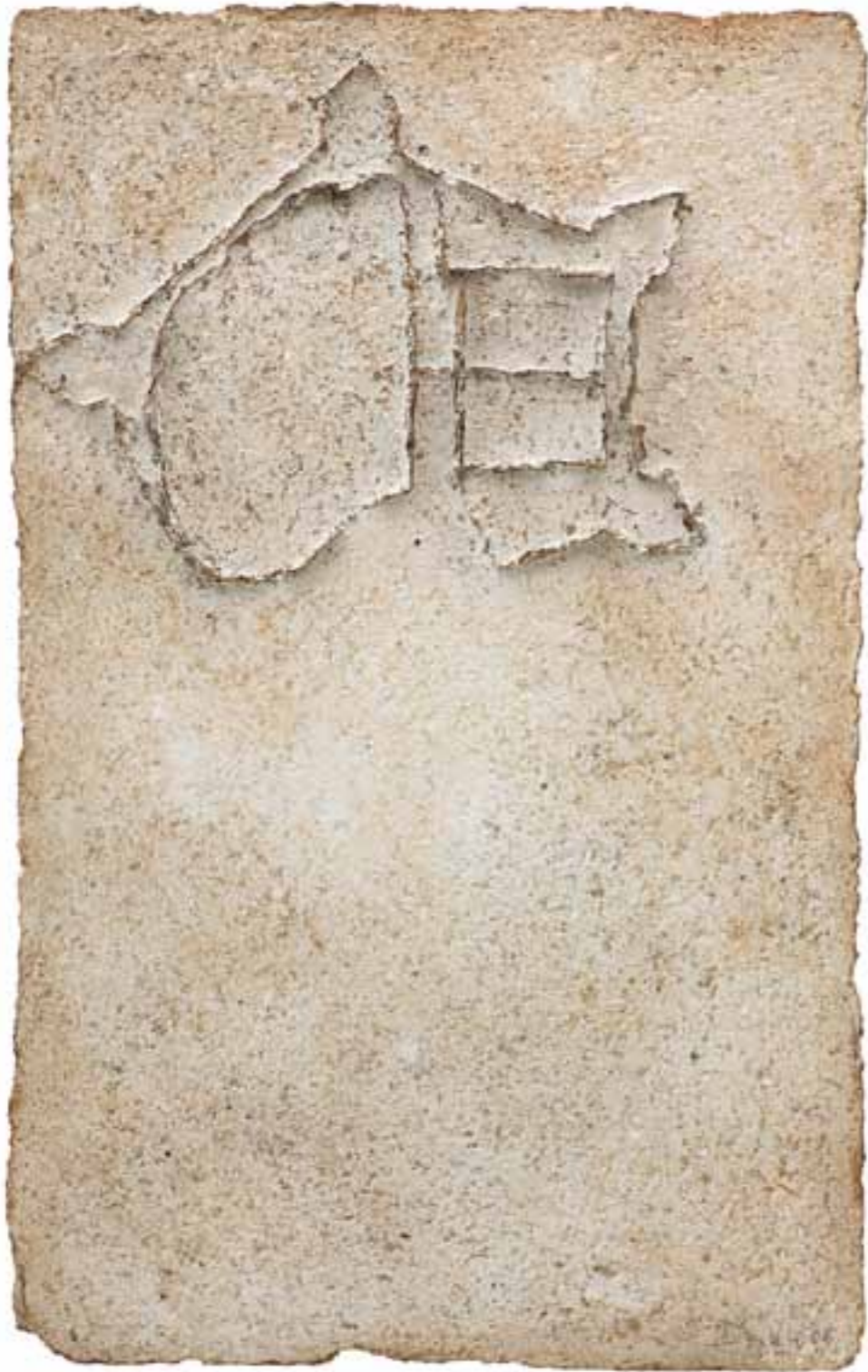
Burganlage, 2005 (77 x 48,5 x 5 cm)