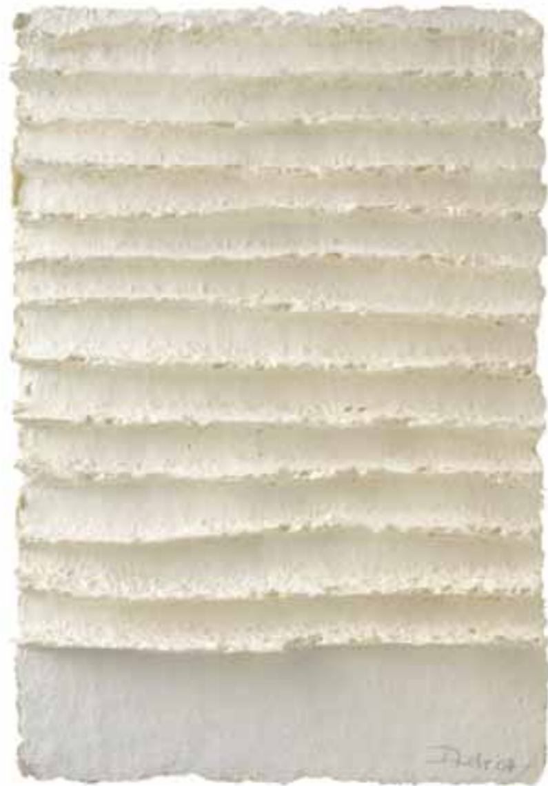
Weißes Relief 03, 2007 (44 x 31 x 3 cm)