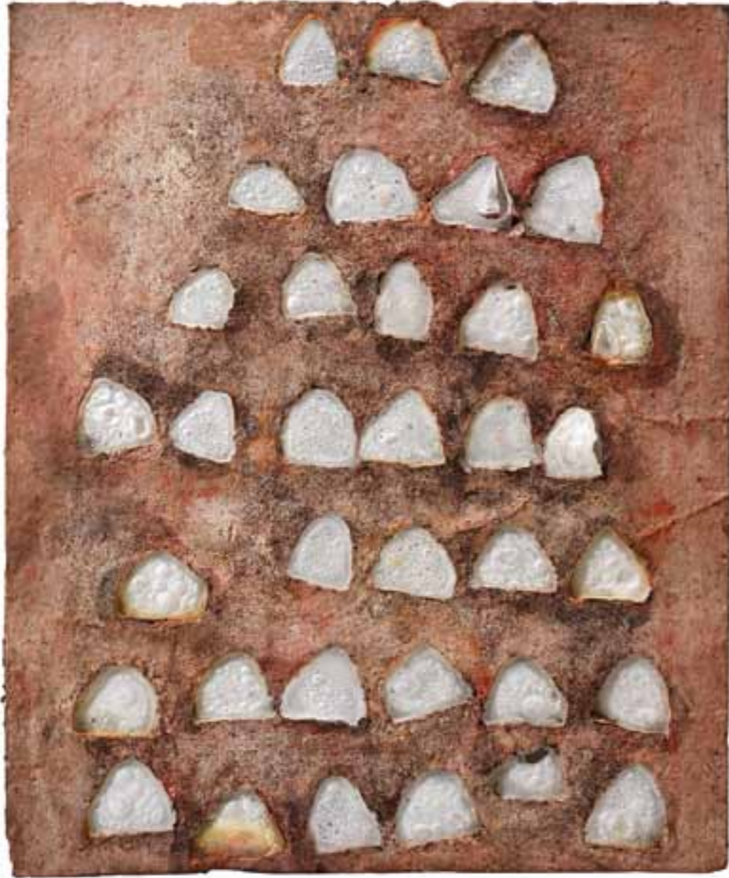
Assier, 2007 (63,5 x 52,5 x 3 cm)