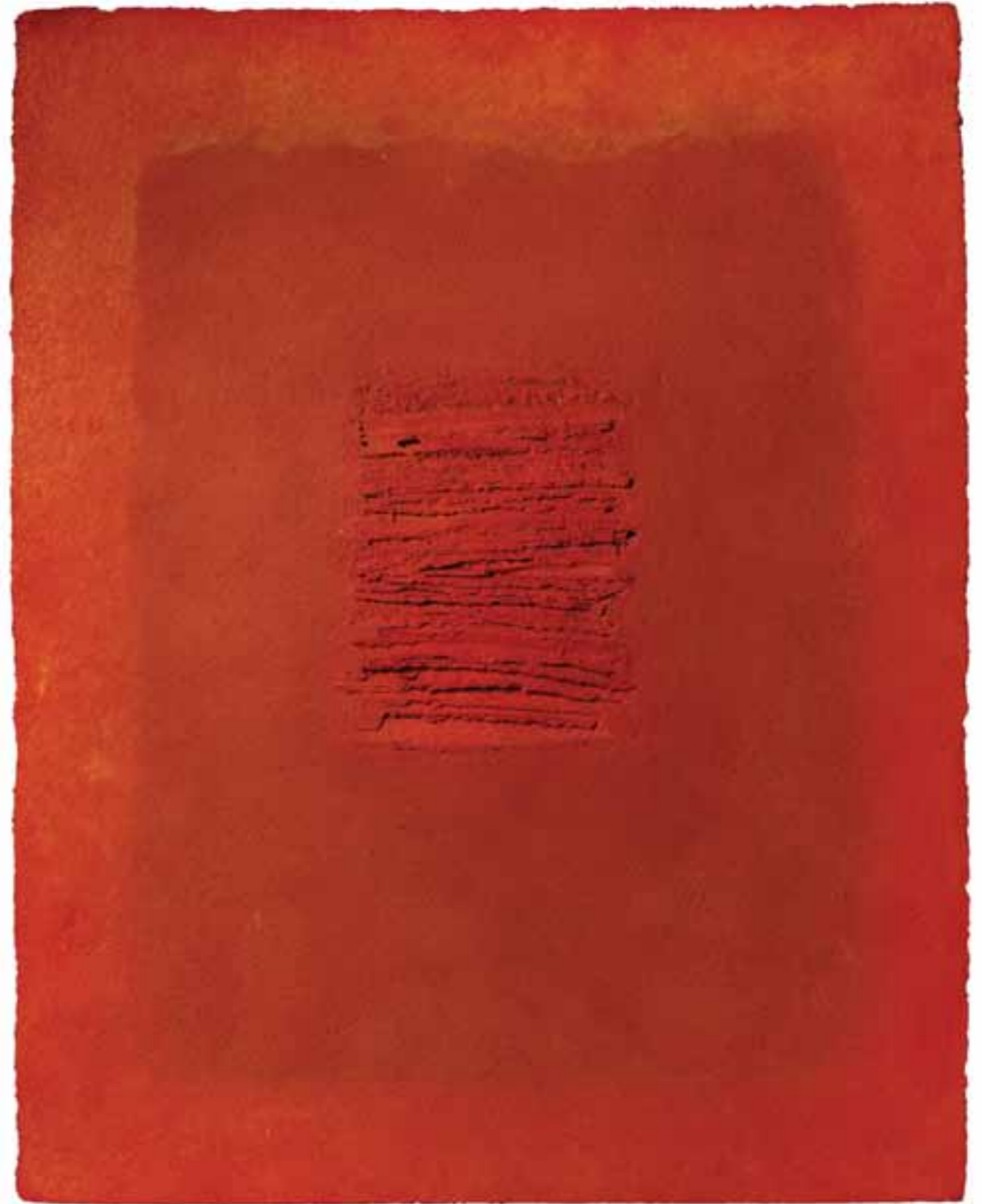
Prolog 16, 2007 (124 x 98 x 1 cm)