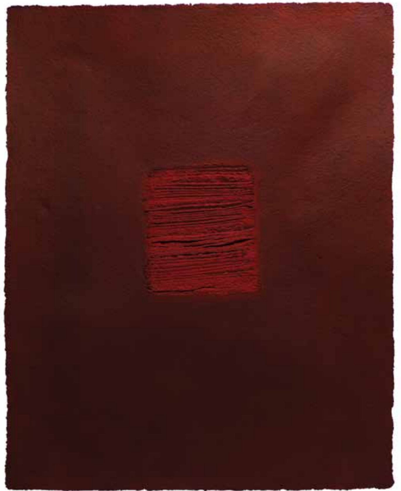
Prolog 20, 2007 (124 x 98 x 1 cm)