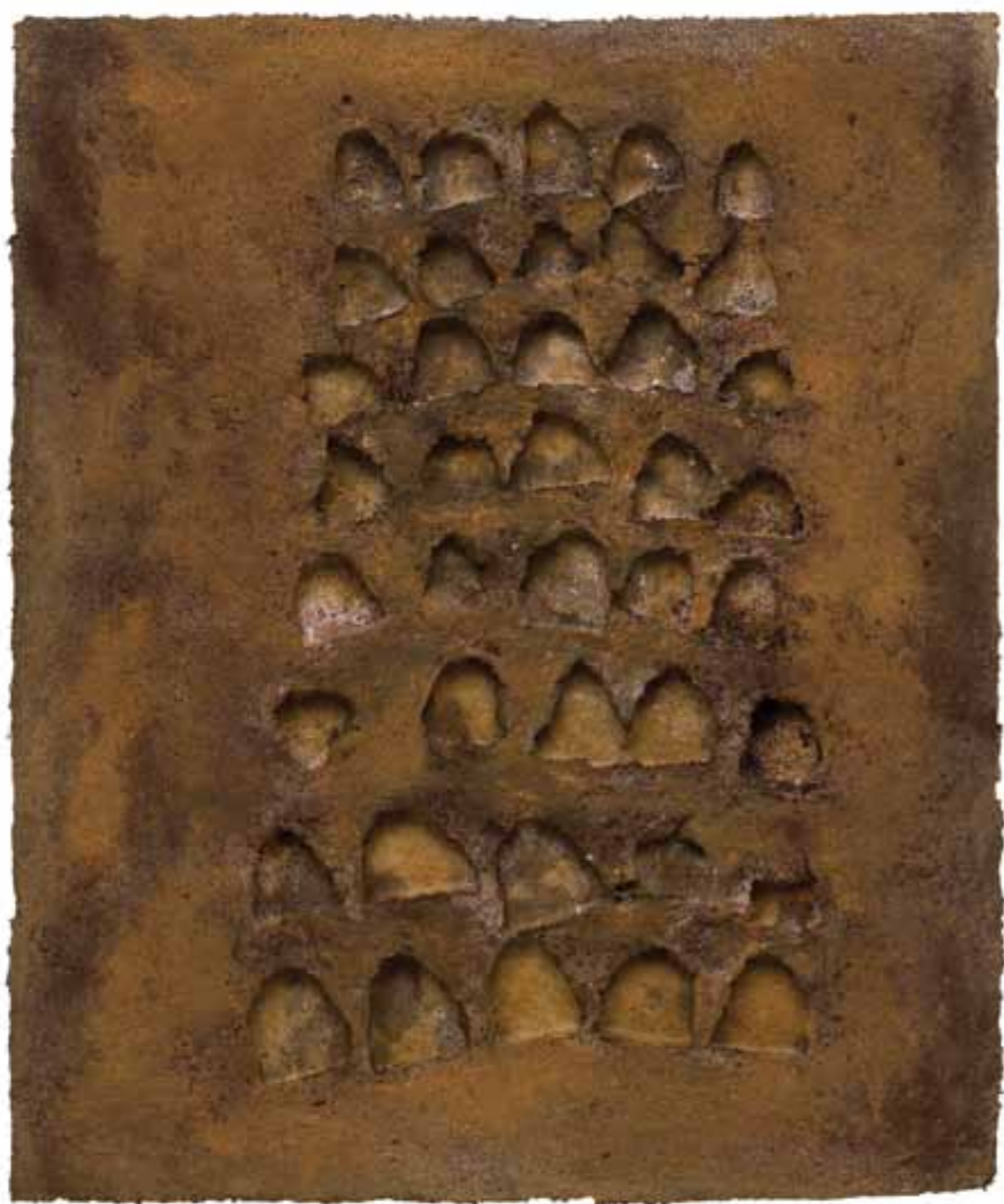
Pigeonier VII, 2003 (86 x 71 x 6 cm)