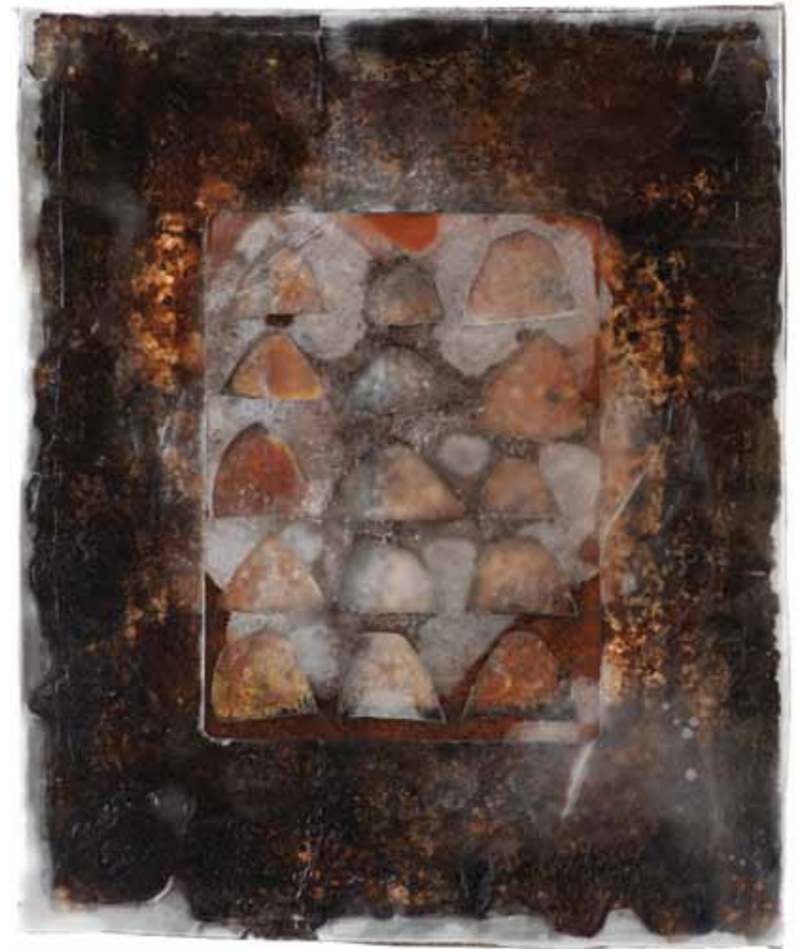
Assier IV, 2004 (49 x 40 x 1 cm)