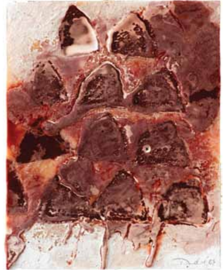
Gaillard IV, 2004 (29 x 23,5 x 1 cm)