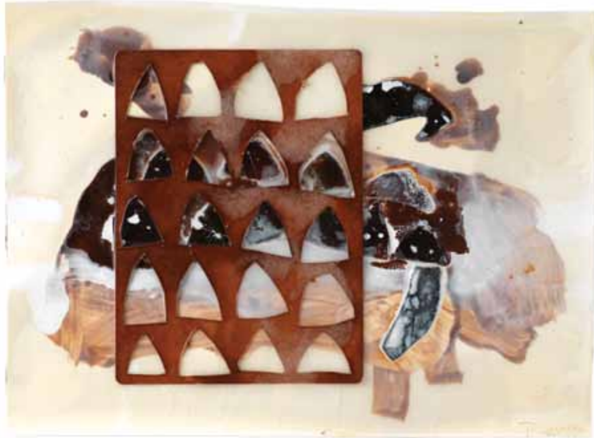
Pech Merle, 2004 (36 x 48 x 1 cm)