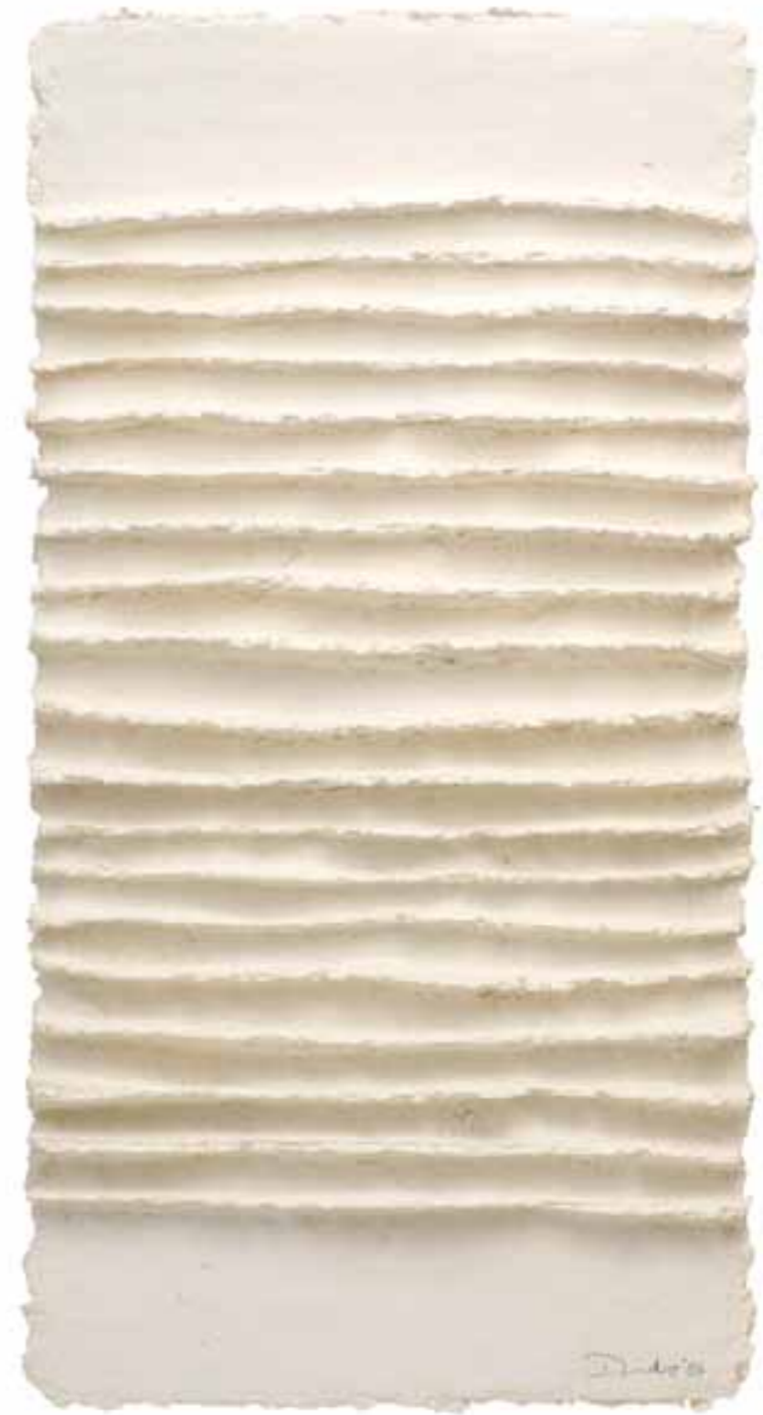
Weißes Relief 13, 2007 (63 x 33 x 3 cm)