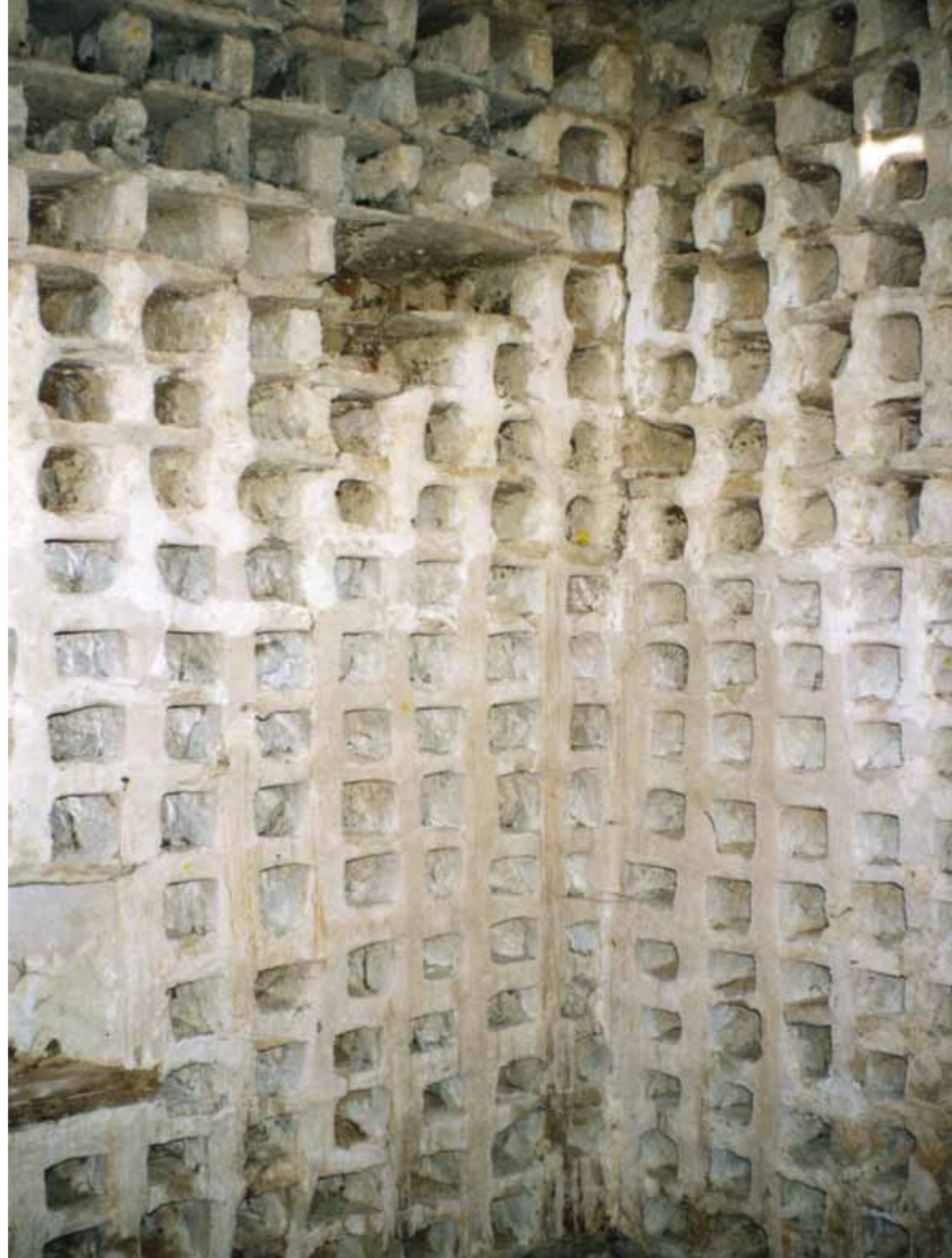
Abb. rechts: Taubenturm (Innenansicht), Burgund (F)