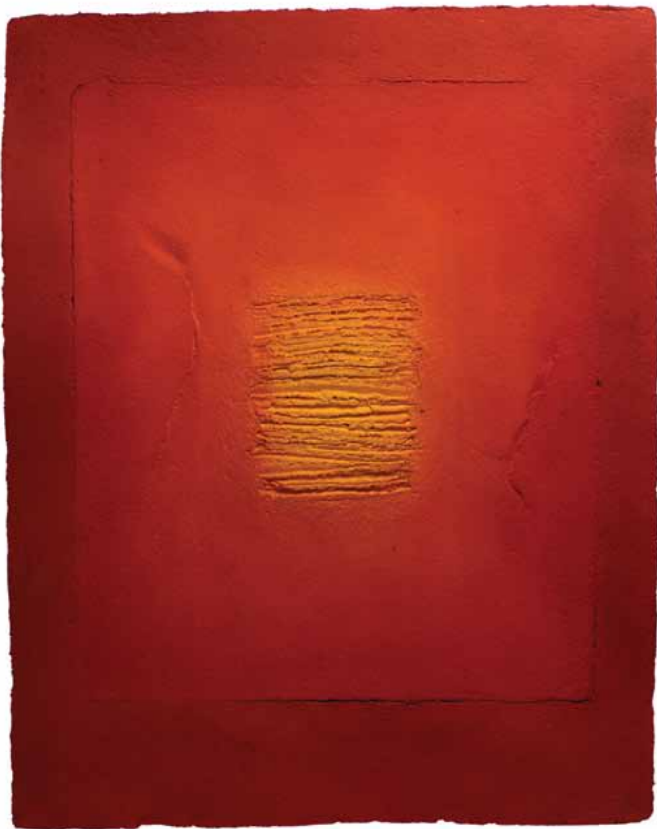
Prolog 21, 2007 (124 x 98 x 1 cm)